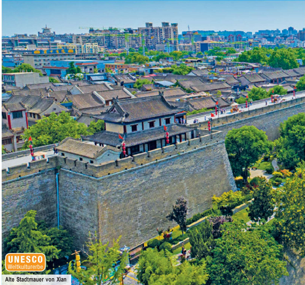
Alte Stadtmauer von Xian