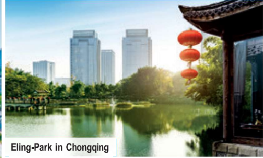
Eling-Park in Chongqing