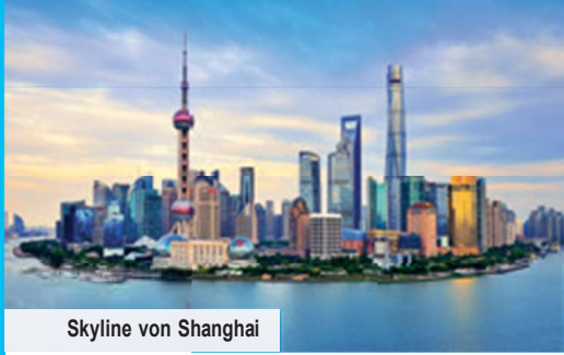
Skyline von Shanghai