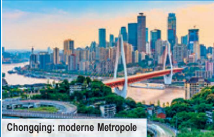
Chongqing: moderne Metropole