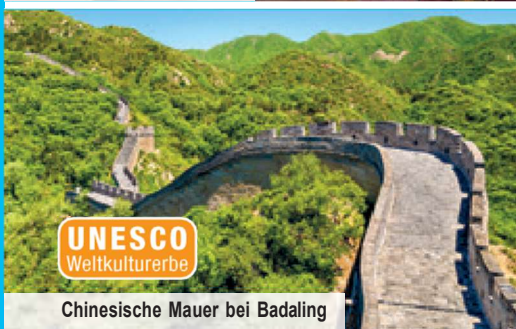
Chinesische Mauer bei Badaling