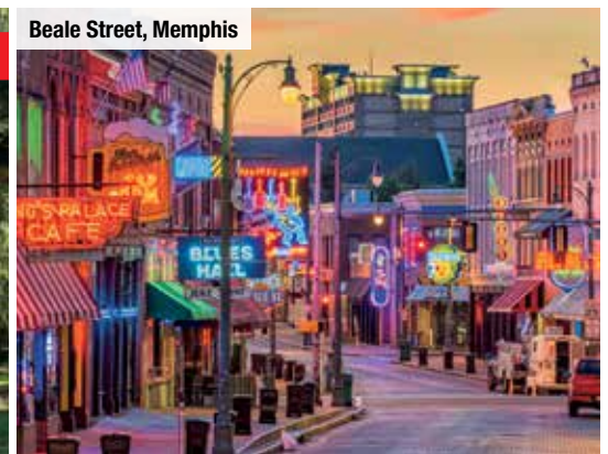
Beale Street, Memphis