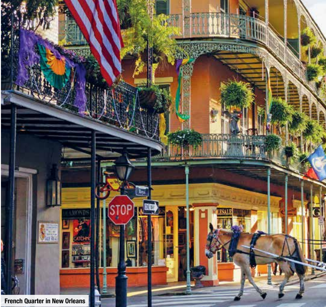
French Quarter in New Orleans