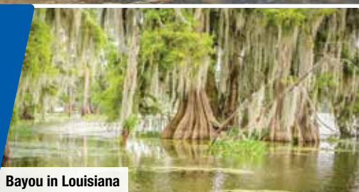
Bayou in Louisiana