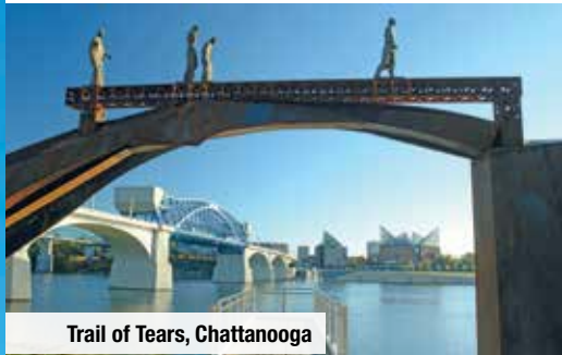
Trail of Tears, Chattanooga