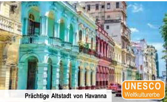
Prächtige Altstadt von Havanna