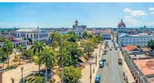
Panoramablick auf den Plaza de Armas in Cienfuegos