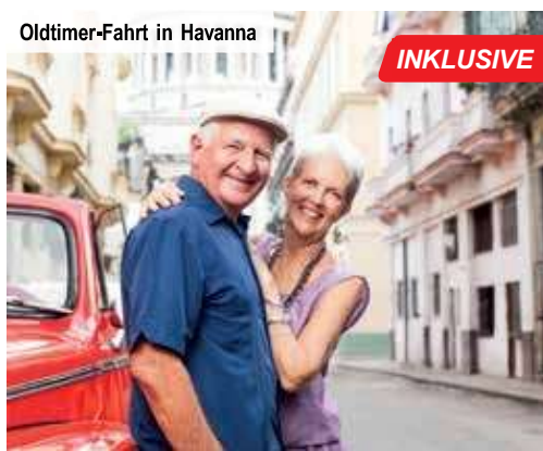
Oldtimer-Fahrt in Havanna