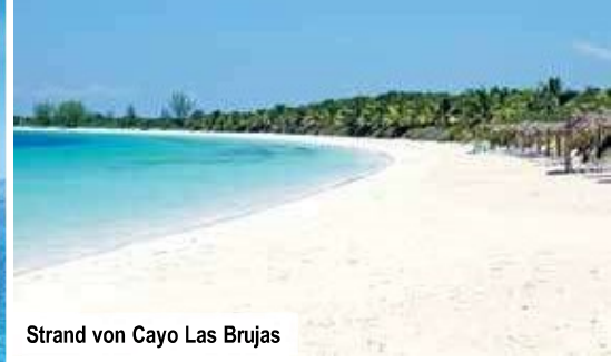
Strand von Cayo Las Brujas