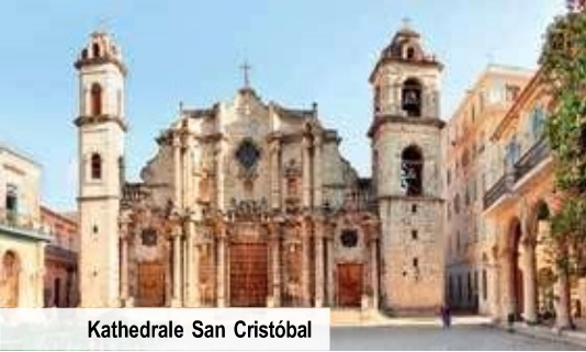
Kathedrale San Cristóbal