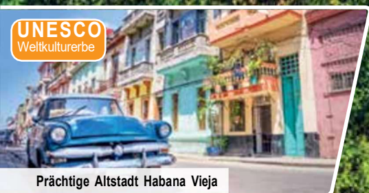
Prächtige Altstadt Habana Vieja