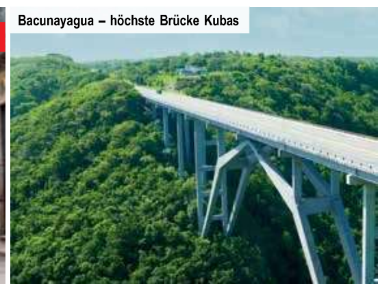
Bacunayagua – höchste Brücke Kubas