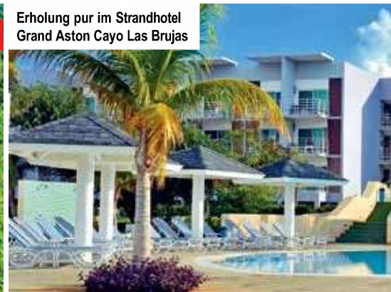
Erholung pur im Strandhotel Grand Aston Cayo Las Brujas