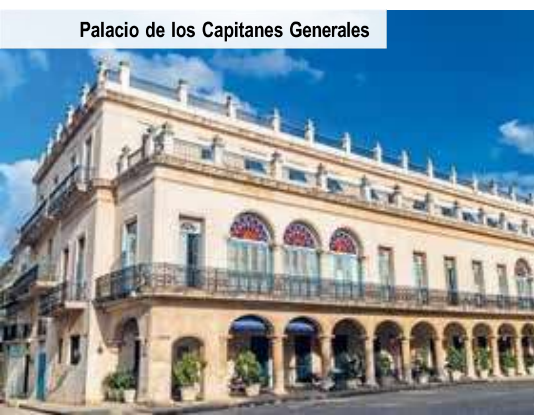
Palacio de los Capitanes Generales