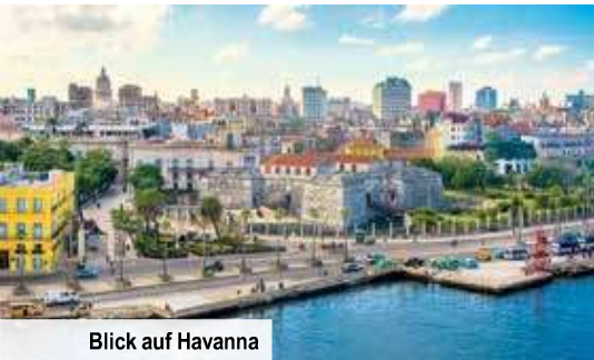
Blick auf Havanna