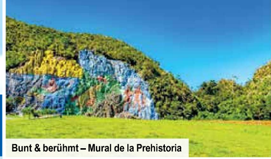
Bunt & berühmt – Mural de la Prehistoria

Stadtbesichtigung mit den Highlights Havannas & kubanischem Mittagessen