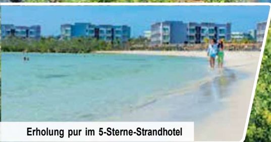
Erholung pur im 5-Sterne-Strandhotel

Großes Erlebnisprogramm mit UNESCO-Welterbe in Havanna, Viñales-Tal, Trinidad & Cienfuegos Genusspaket & 6 Übernachtungen im 5-Sterne-Strandhotel