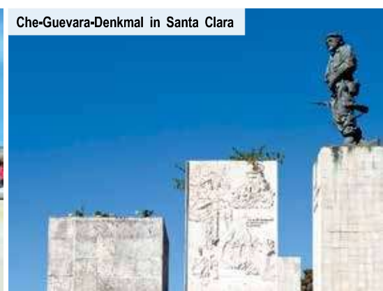
Che-Guevara-Denkmal in Santa Clara