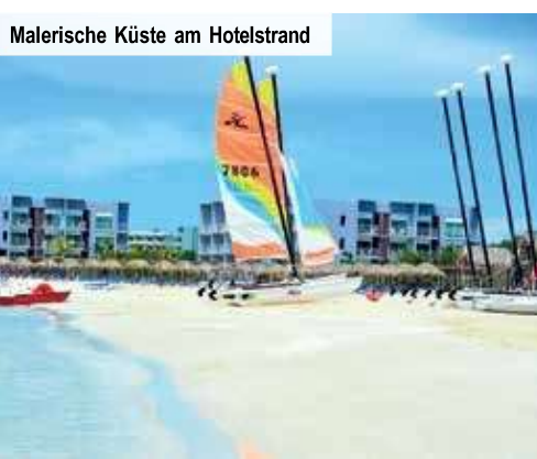
Malerische Küste am Hotelstrand