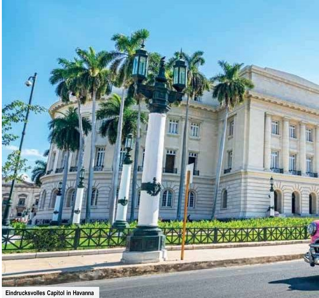
Eindrucksvolles Capitol in Havanna