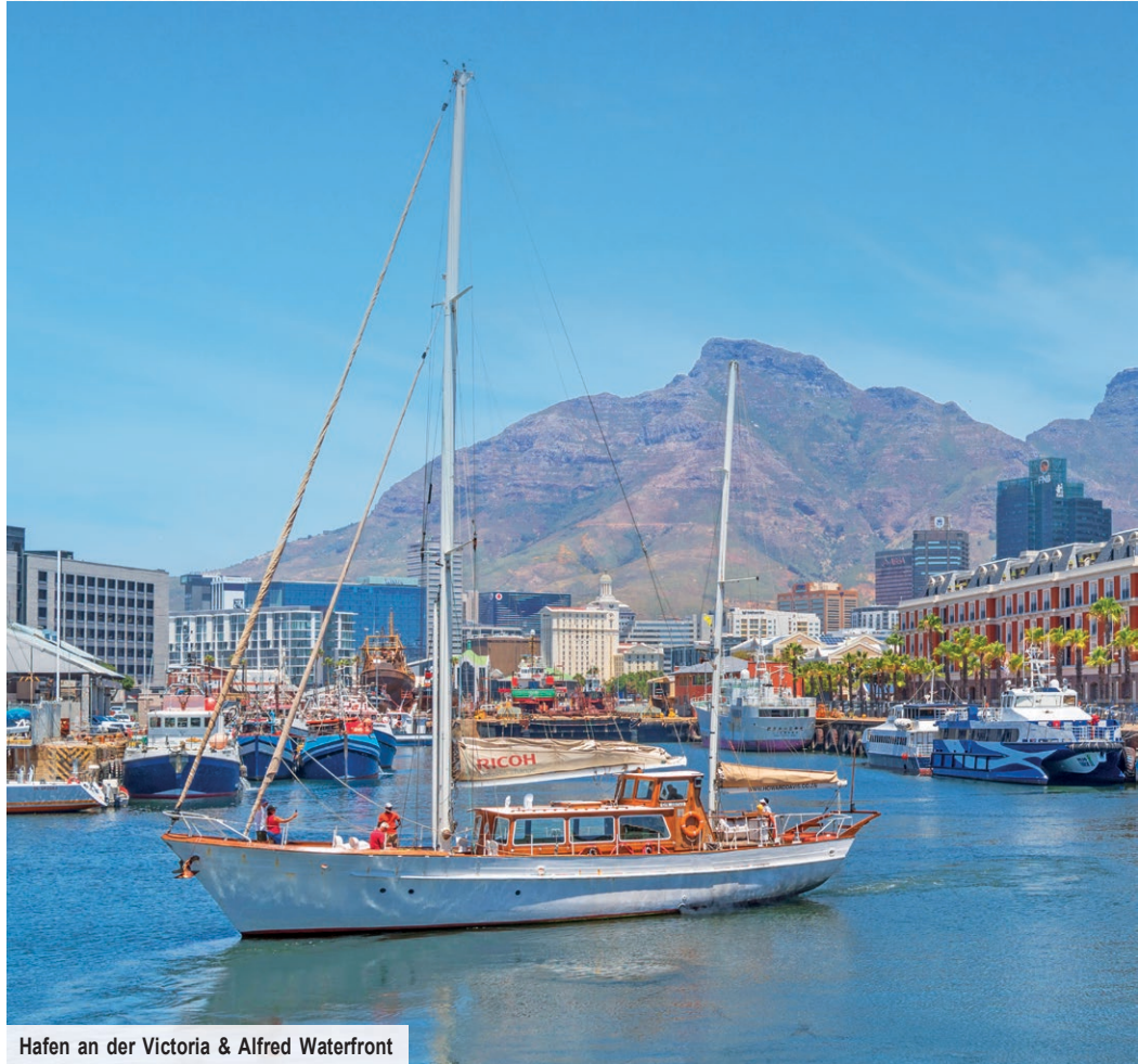
Hafen an der Victoria & Alfred Waterfront