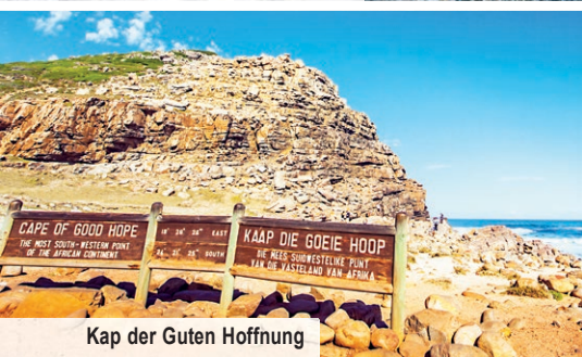
Kap der Guten Hoffnung