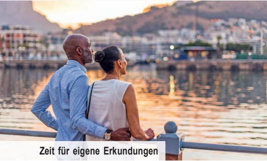
Zeit für eigene Erkundungen