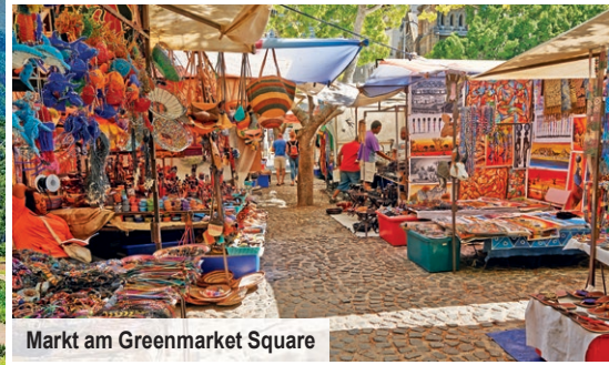
Markt am Greenmarket Square