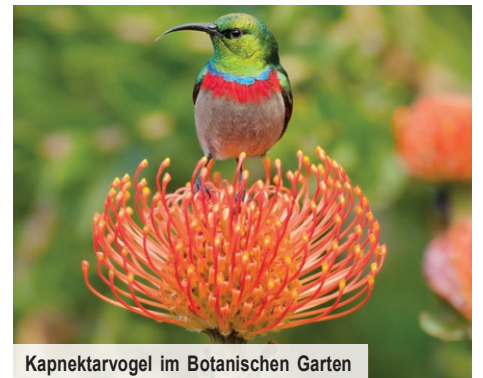
Kapnektarvogel im Botanischen Garten

Der idyllische Küstenort Camps Bay am malerischen Sandstrand und unter der majestätischen Bergkette der 12 Apostel ist nicht nur ein Foto wert. An der Palmenpromenade Zeit zu verbringen und beispielsweise eines der lauschigen Cafés zu besuchen, verleiht Ihrer Seele Flügel, die Sie über die wundervoll-wogenden Wellen beider Weltmeere tragen.