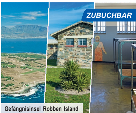
Gefängnisinsel Robben Island

Anblick des Panoramas, das sich Ihnen hier bietet: Kapstadt liegt Ihnen zu Füßen, davor das weite, blaue Meer. Kennen Sie die Momente im Leben, in denen man am liebsten die Zeit anhalten würde?