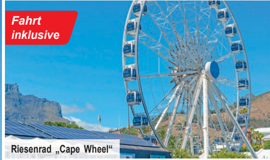
Riesenrad „Cape Wheel“

Erleben Sie die schönsten Highlights wie die malerischen Viertel Victoria & Alfred Waterfront, Bo-Kaap sowie Camps Bay, freuen Sie sich auf eine Riesenradfahrt und den Botanischen Garten Kirstenbosch.