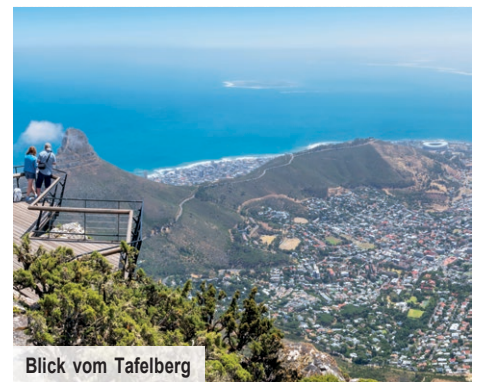
Blick vom Tafelberg

Im Südafrikanischen Museum staunen Sie über die bewegte Geschichte des Landes sowie viele interessante historische Artefakte und bei Ihrem Spaziergang durch die Company Gardens genießen Sie den schönsten Park der Stadt. Der historische Park wurde einst von der Niederländischen Ostindien-Kompanie angelegt und diente als Fläche für den Obst- und Gemüseanbau.