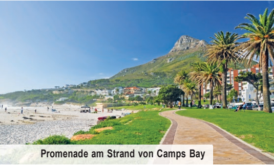
Promenade am Strand von Camps Bay