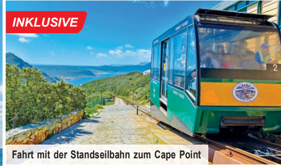
INKLUSIVE Fahrt mit der Standseilbahn zum Cape Point