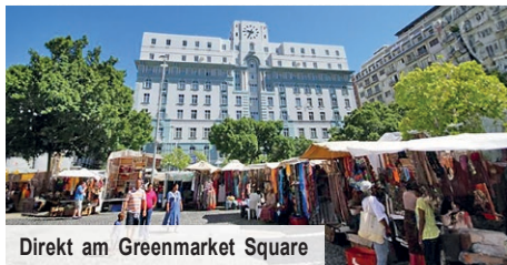
Direkt am Greenmarket Square

Es liegt direkt am Greenmarket Square, auf dem Kunsthandwerk angeboten wird. Fußläufig erreichen Sie darüber hinaus auch zahlreiche Bars, Restaurants und Cafés sowie beliebte Orte, wie beispielsweise die Long Street, Kapstadts pulsierende Lebensader.