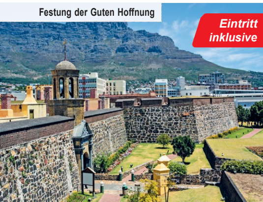
Festung der Guten Hoffnung

Gönnen Sie sich anschließend eine unvergessliche, vor Ort zubuchbare Fahrt auf den Tafelberg! Er ist nicht nur der Hausberg Kapstadts, sondern auch das Wahrzeichen der Metropole, welches das Stadtbild unverkennbar prägt. Hier ist bereits der Weg das Ziel, wenn Sie in der modernen Gondel in den Himmel steigen. Oben angekommen verschlägt es Ihnen schier die Sprache beim