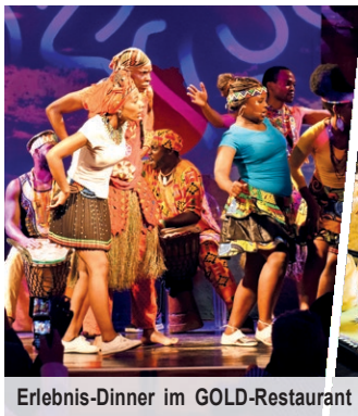
Erlebnis-Dinner im GOLD-Restaurant