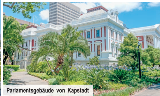
Parlamentsgebäude von Kapstadt