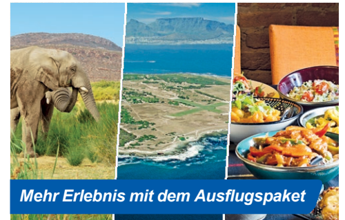
Mehr Erlebnis mit dem Ausflugspaket