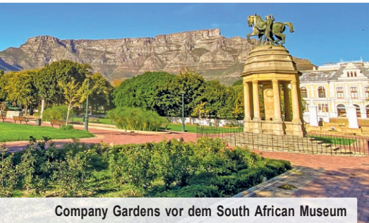
Company Gardens vor dem South African Museum