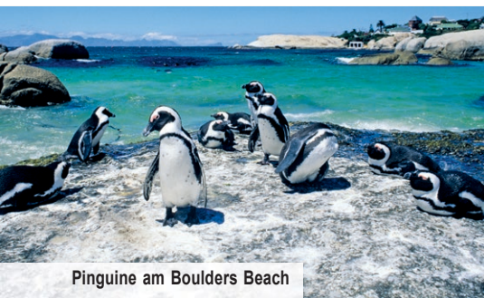
Pinguine am Boulders Beach