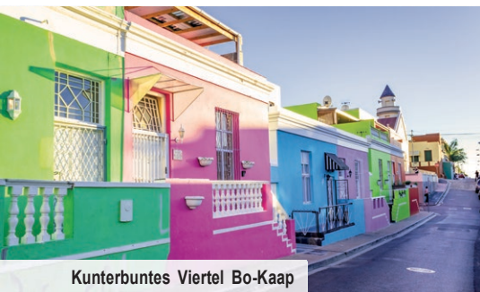
Kunterbuntes Viertel Bo-Kaap