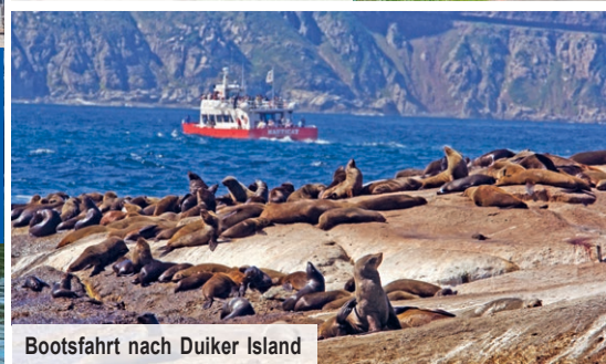
Bootsfahrt nach Duiker Island