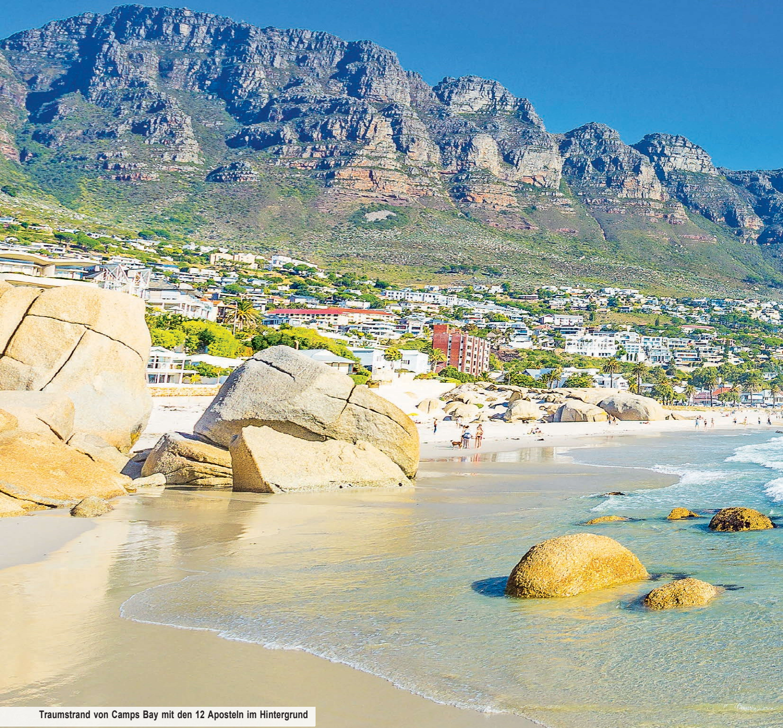
Traumstrand von Camps Bay mit den 12 Aposteln im Hintergrund

Es ist Zeit für eine Reise zu Ihrer Wunderstadt am Ende der Welt, Ihrem Kapstadt!