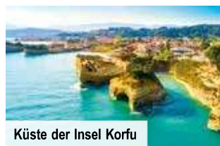
Küste der Insel Korfu

Bei Vorabbuchung sparen Sie € 30 p. P. € 89 p. P.