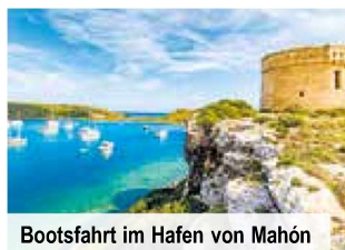
Bootsfahrt im Hafen von Mahón

Tag 5: Erkunden Sie die Insel auf eigene Faust oder erleben Sie die Traditionen Menorcas auf einem zubuchbaren Ganztagesausflug: Besichtigung einer Käse- und Wein-Manufaktur in Sant Patrici, Besuch des Ortes Es Mercadal, Aufenthalt an