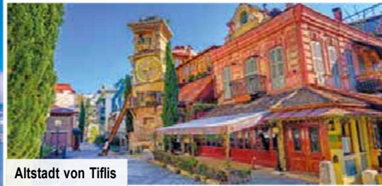
Altstadt von Tiflis