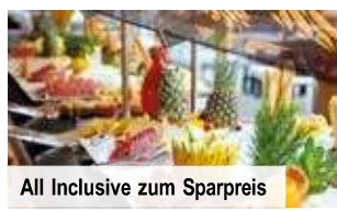
All Inclusive zum Sparpreis