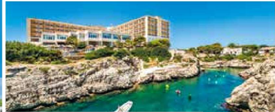
4-Sterne-Hotel Globales Almirante Farragut