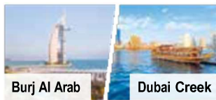
Burj Al Arab

Ausflug „Traditionelles Dubai mit Mittagessen im Burj Al Arab“ Besuch des Bastakiya-Viertels , Abra-Fahrt über den Dubai Creek , Besuch des Gold- & Gewürzmarktes , Fotostopp an der Jumeirah-Moschee , Mittagessen als 2-Gänge-Menü im Al-Muntaha-Restaurant im Burj Al Arab . € 199 p. P. Bei Vorabbuchung sparen Sie € 20 p. P. € 179 p. P.