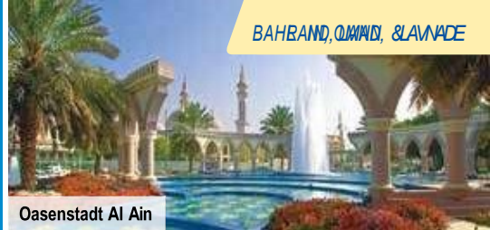
Oasenstadt Al Ain

✓ Kleingruppen-Erlebnis zum besten Preis-Leistungs-Verhältnis ✓ Kurze Wartezeiten, schneller Check-in & Check-out