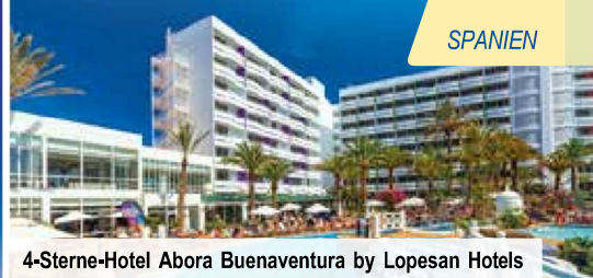
4-Sterne-Hotel Abora Buenaventura by Lopesan Hotels