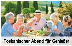
Toskanischer Abend für Genießer

REISETERMINE 2025 (Ermitteln Sie mit der 1. Stelle Ihrer Postleitzahl Ihren Reiseternin)