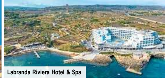
Labranda Riviera Hotel & Spa