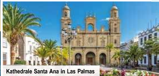
Kathedrale Santa Ana in Las Palmas