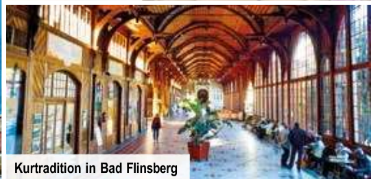
Kurtradition in Bad Flinsberg