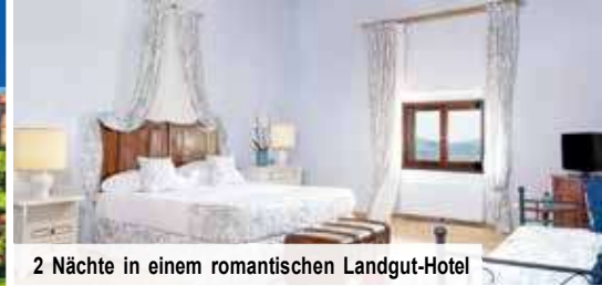
2 Nächte in einem romantischen Landgut-Hotel