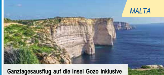
Ganztagesausflug auf die Insel Gozo inklusive