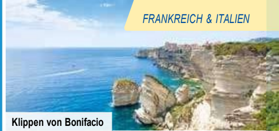
Klippen von Bonifacio