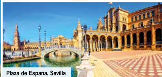
Plaza de España, Sevilla