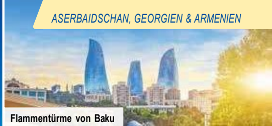
Flamentürme von Baku