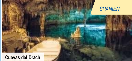
Cuevas del Drach

Alle verfügbaren Reiseternine & Flughäfen finden Sie auf trendtours.de