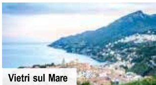
Vietri sul Mare