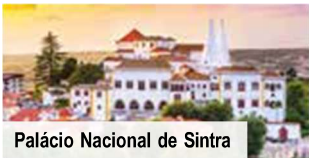
Palácio Nacional de Sintra

Tag 4: Ganztagesausflug an die Algarve mit Sagres, Lagos & Silves