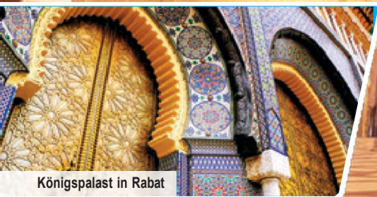
Königspalast in Rabat

Großes Ausflugsprogramm mit 7 UNESCO-Welterbestätten 4 Königsstädte Fès, Meknès, Marrakesch & Rabat Kulinarisches Genusspaket