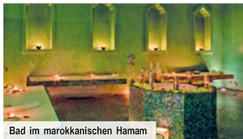
Bad im marokkanischen Hamam

Einreisebestimmungen: Für diese Reise benötigen Deutsche, Schweizer sowie alle EU-Staatsbürger einen Reisepass, der bei Reisebeginn noch mind. 6 Monate gültig ist. Die Einreise nach Marokko ist visafrei. Über eventuelle Änderungen werden Sie rechtzeitig vor Reisebeginn informiert. (Stand: Feb. 2025)