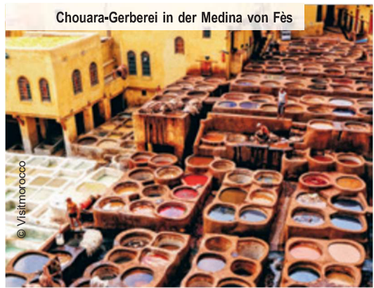
Chouara-Gerberei in der Medina von Fès

Nach dem Genuss Ihres Frühstücks im Hotel fliegen Sie heute zurück nach Hause.