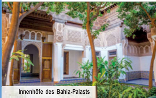
Innenhöfe des Bahia-Palasts