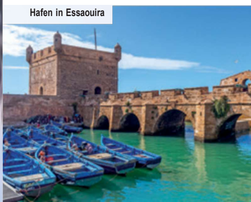
Hafen in Essaouira

Marrakesch wird Sie garantiert in Staunen versetzen. Sie sehen erst die Koutoubia-Moschee, die gleichzeitig die größte Moschee der Stadt und die älteste ganz Marokkos ist. Eindrucksvoll ist besonders das 77 Meter hohe Minarett der Moschee,