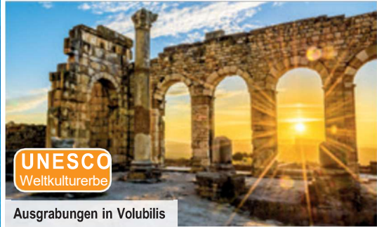
Ausgrabungen in Volubilis