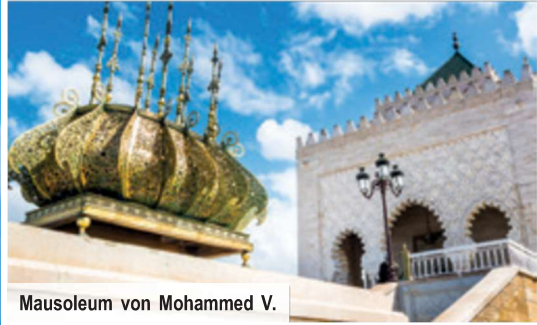
Mausoleum von Mohammed V.

INKLUSIVE Stadtbesichtigung von Rabat mit Mohamed-V.-Mausoleum, Hassan Tower & Kasbah Oudaya