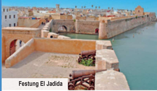
Festung El Jadida