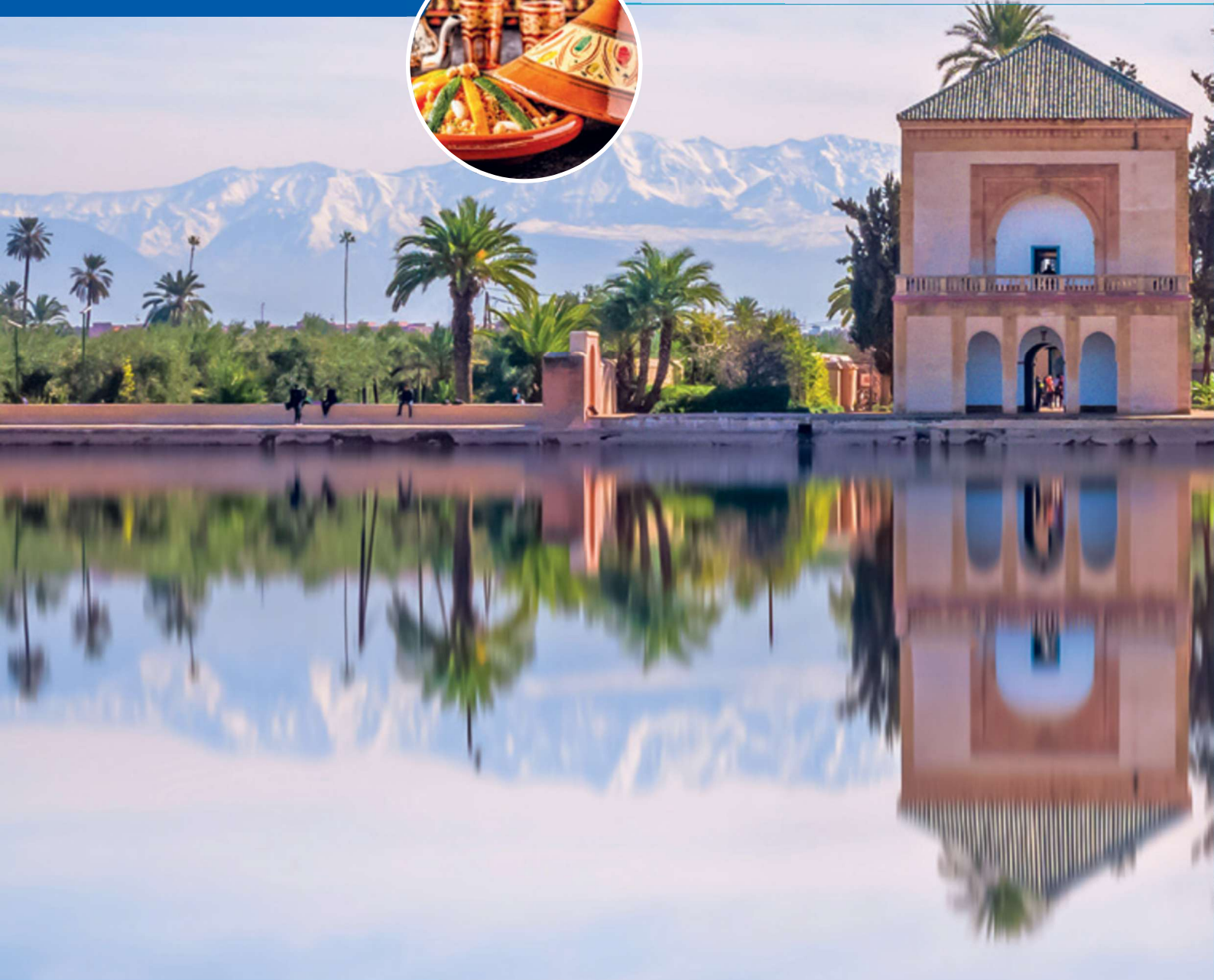
Saadian-Pavillon in den Menara-Gärten von Marrakesch