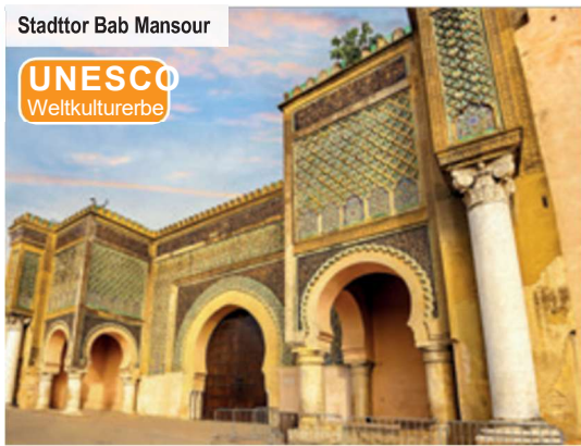
Stadttor Bab Mansour