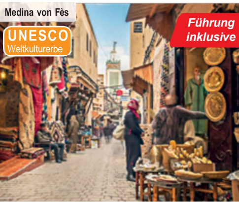
Medina von Fès