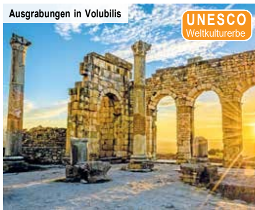
Ausgrabungen in Volubilis