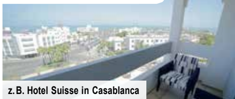
z. B. Hotel Suisse in Casablanca