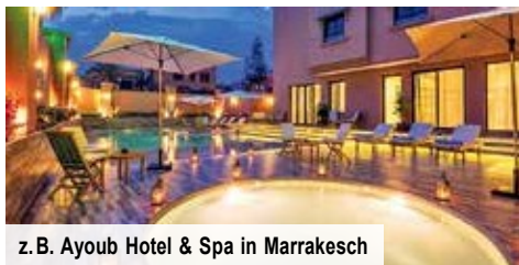
z. B. Ayoub Hotel & Spa in Marrakesch