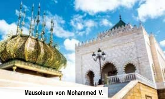
Mausoleum von Mohammed V.