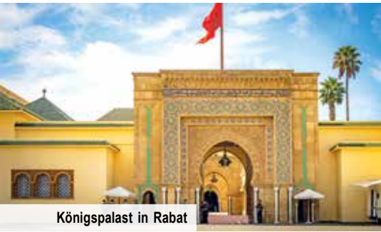
Königspalast in Rabat