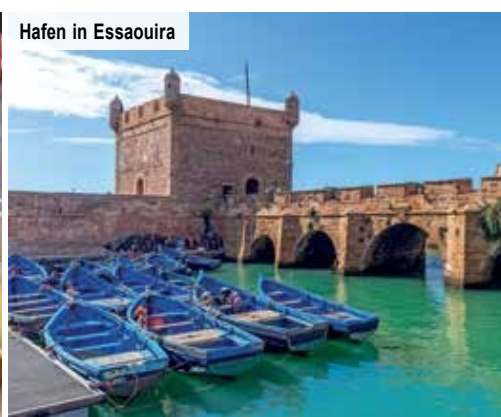
Hafen in Essaouira