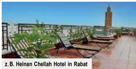
z. B. Helnan Chellah Hotel in Rabat