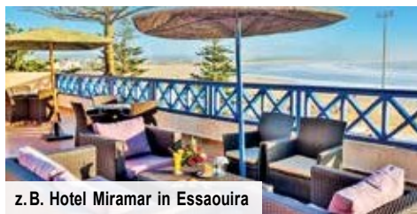
z. B. Hotel Miramar in Essaouira