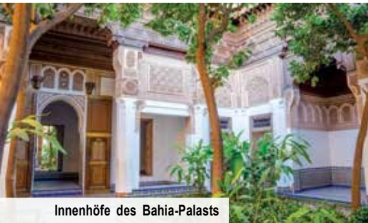
Innenhöfe des Bahia-Palasts