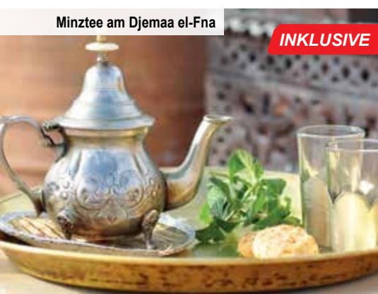
Minztee am Djemaa el-Fna

Nach Ihrer Ankunft im Hotel, in dem Sie heute und morgen übernachten werden, und dem nächsten Abendessen können Sie auf Wunsch in einem Hamam beim traditionellen marokkanischen Baderitual Ruhe und Entspannung finden.