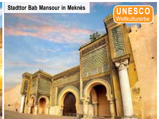
Stadttor Bab Mansour in Meknès