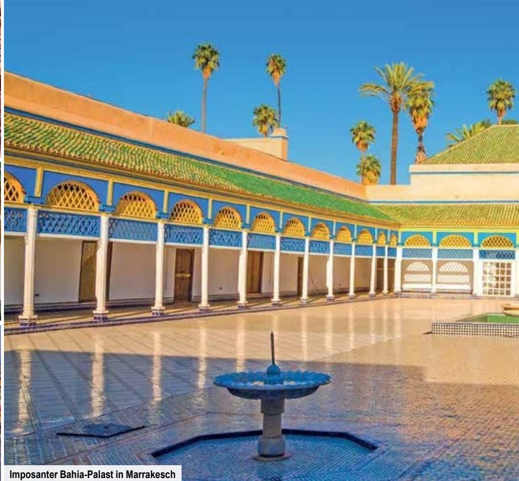
Imposanter Bahia-Palast in Marrakesch

Die letzte Etappe führt zu Ihrem heutigen Tagesziel, Marrakesch. Dort angelangt beziehen Sie Ihr Hotel für die kommenden zwei Nächte und lassen es sich beim Abendessen gut gehen.