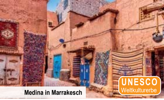
Medina in Marrakesch