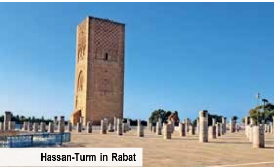
Hassan-Turm in Rabat