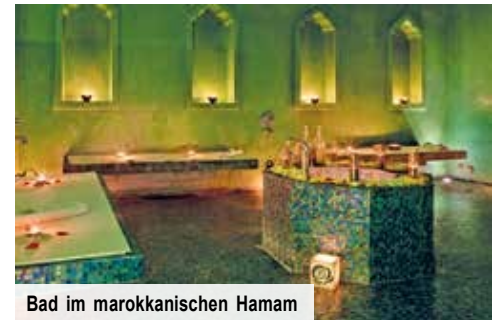
Bad im marokkanischen Hamam

Pflegeritual im marokkanischen Hamam (Tag 7) Finden Sie Ruhe und Entspannung beim traditionellen marokkanischem Baderitual (inkl. Transfer) Nur Vorabbuchung € 49 p. P.