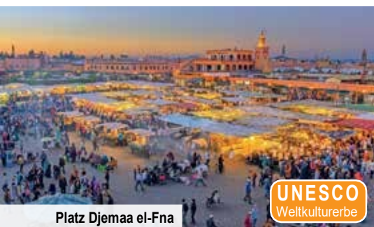
Platz Djemaa el-Fna