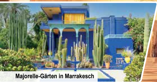
Majorelle-Gärten in Marrakesch

Großes Ausflugsprogramm mit 7 UNESCO-Welterbestätten 4 Königsstädte Fès, Meknès, Marrakesch & Rabat Kulinarisches Genusspaket