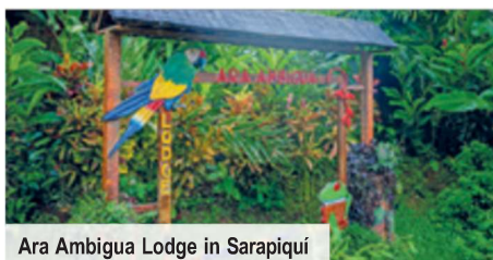
Ara Ambigua Lodge in Sarapiquí