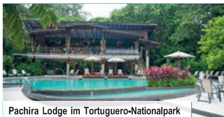
Pachira Lodge im Tortuguero-Nationalpark