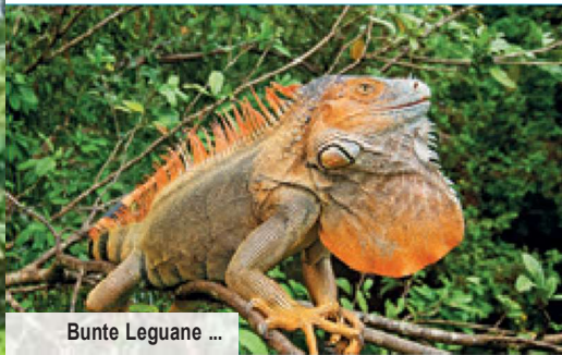
Bunte Leguane ...