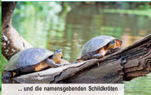
... und die namensgebenden Schildkröten