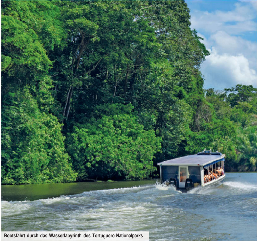
Bootsfahrt durch das Wasserlabyrinth des Tortuguero-Nationalparks