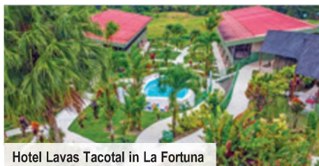
Hotel Lavas Tacotal in La Fortuna