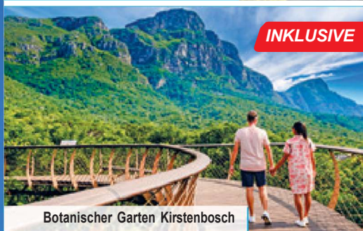
Botanischer Garten Kirstenbosch