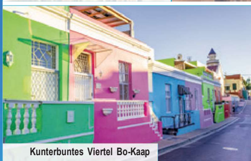
Kunterbuntes Viertel Bo-Kaap