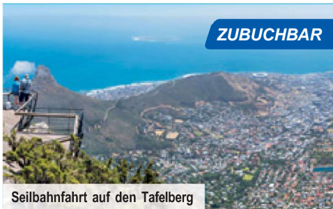
Seilbahnfahrt auf den Tafelberg

Einreisebestimmungen: Für diese Reise benötigen Deutsche sowie Reisende u. a. aus der Schweiz, Österreich, Italien, Frankreich oder Spanien einen mindestens einen Monat über das Reiseende hinaus gültigen Reisepass, der bei Ausreise über zwei freie Seiten verfügen muss. (Stand: Januar 2025)