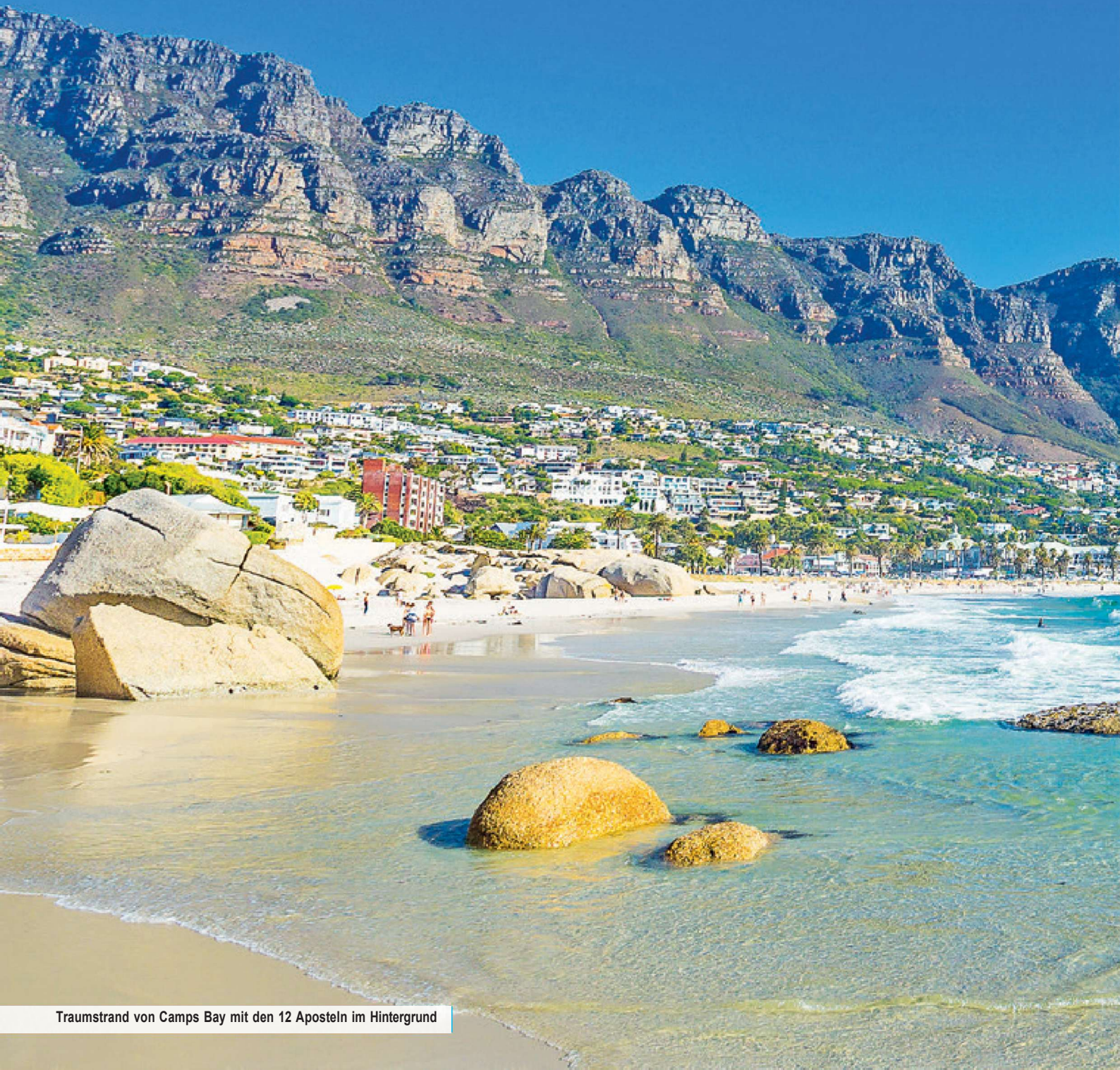
Traumstrand von Camps Bay mit den 12 Aposteln im Hintergrund

Es ist Zeit für eine Reise zu Ihrer Wunderstadt am Ende der Welt, Ihrem Kapstadt!