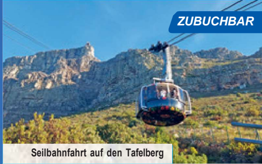
Seilbahnfahrt auf den Tafelberg