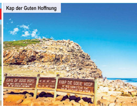
Kap der Guten Hoffnung