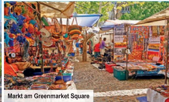
Markt am Greenmarket Square