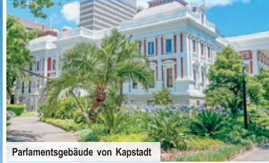
Parlamentsgebäude von Kapstadt

Erleben Sie die schönsten Highlights wie die malerischen Viertel Victoria & Alfred Waterfront, Bo-Kaap sowie Camps Bay und freuen Sie sich unter anderem auf den Botanischen Garten Kirstenbosch.