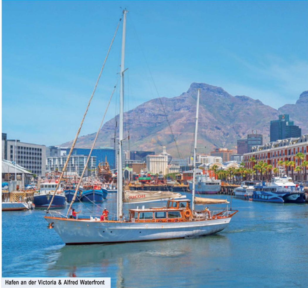
Hafen an der Victoria & Alfred Waterfront