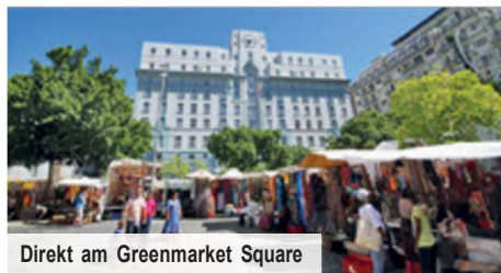
Direkt am Greenmarket Square

In Ihrem zentral gelegenen Hotel, zum Beispiel dem ONOMO Hotel Cape Town – Inn on the Square, werden Sie sich garantiert wohlfühlen. Das modern eingerichtete Hotel hat alles, was man von einem Stadthotel erwarten darf.