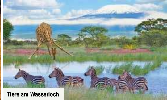
Tiere am Wasserloch

Das Schutzgebiet ist weltweit bekannt für seine intakte Elefanten-Population. Neben jungen Tieren leben auch viele alte Elefantenkühe und -bullen im Schutzgebiet, sodass das komplexe Sozialverhalten hier gut beobachtet werden kann.