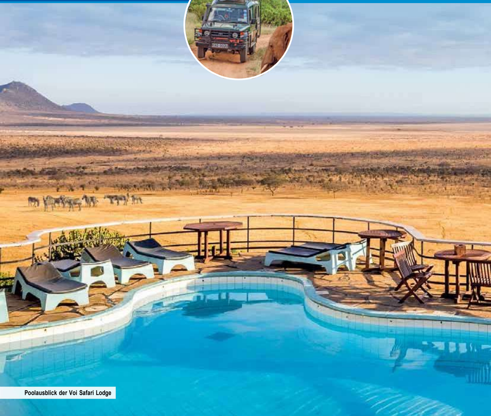
Poolausblick der Voi Safari Lodge