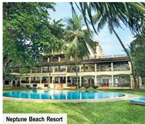
Neptune Beach Resort