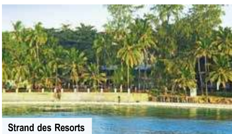
Strand des Resorts

Einreisebestimmungen: Deutsche, Schweizer und alle EU-Staatsbürger benötigen einen maschinenlesbaren Reisepass, der noch mind. 6 Monate über das Reiseende hinaus gültig ist, sowie eine gültige eTA-Einreiseerlaubnis für Kenia, die auf Wunsch gegen eine Gebühr von trendtours für Sie beantragt wird. Ein vorläufiger Reisepass wird nicht akzeptiert. (Stand Januar 2024)