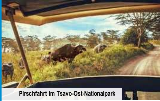
Pirschfahrt im Tsavo-Ost-Nationalpark