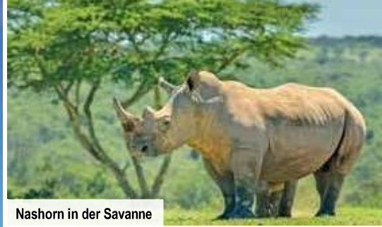
Nashorn in der Savanne