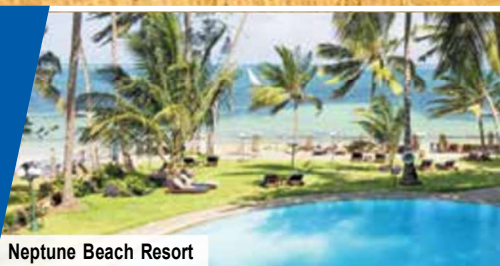
Neptune Beach Resort

7 Tage im 4-Sterne-Strandhotel am Indischen Ozean mit All Inclusive