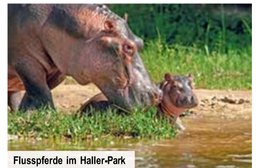
Flusspferde im Haller-Park

Halbtägiger Besuch des Haller-Parks Neben Flusspferden, Giraffen, Krokodilen, Antilopen und Landschildkröten staunen Sie auch über die einheimische Pflanzenwelt im Park. Nur Vorabbuchung € 49 p. P.