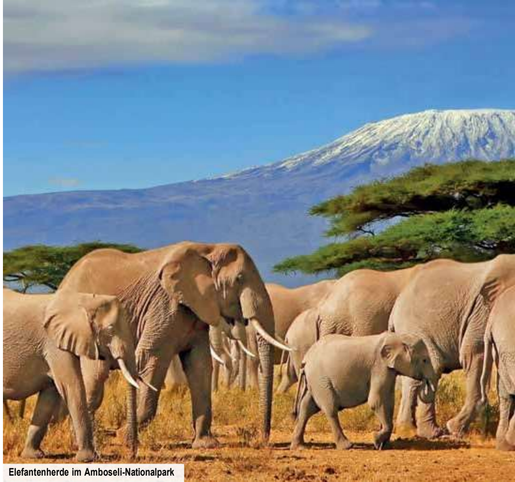
Elefantenherde im Amboseli-Nationalpark