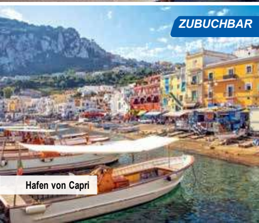
Hafen von Capri