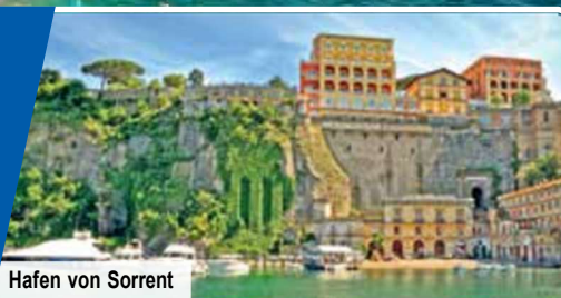
Hafen von Sorrent

Besonderes Highlight: Schiffsfahrt entlang der Amalfiküste