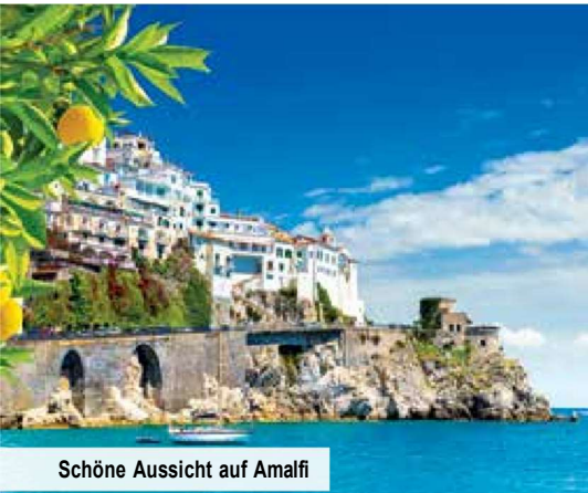
Schöne Aussicht auf Amalfi