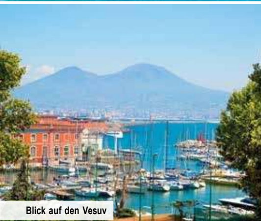
Blick auf den Vesuv