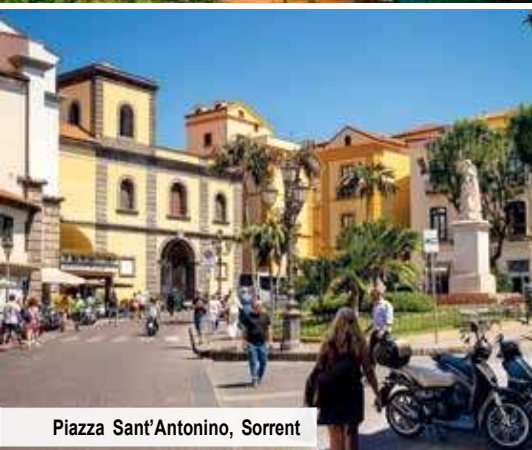
Piazza Sant'Antonino, Sorrent