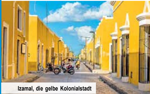
Izamal, die gelbe Kolonialstadt