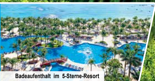
Badeaufenthalt im 5-Sterne-Resort