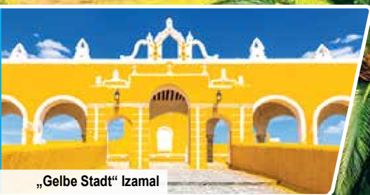
„Gelbe Stadt“ Izamal

Erlebnisprogramm mit den UNESCO- Welterben Chichén Itzá, Palenque, Uxmal & Campeche sowie der verborgenen Mayastätte Yaxchilán Erholung im 5-Sterne-Strandresort