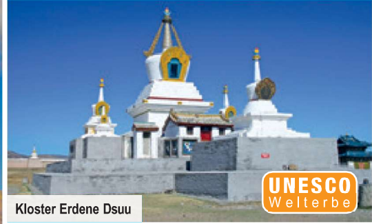
Kloster Erdene Dsuu

Der Sternenhimmel über Ihnen, die Weite der Steppe um Sie herum – authentischer als in traditionellen Jurten kann man die Mongolei nicht erleben. Wir haben 9 Übernachtungen für Sie inkludiert!