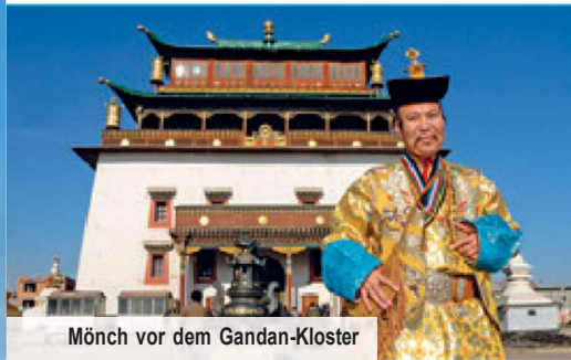
Mönch vor dem Gandan-Kloster