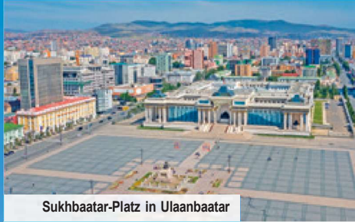
Sukhbaatar-Platz in Ulaanbaatar