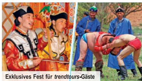
Exklusives Fest für trendtours-Gäste