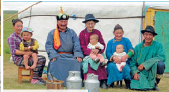
Zu Gast bei Nomadenfamilien