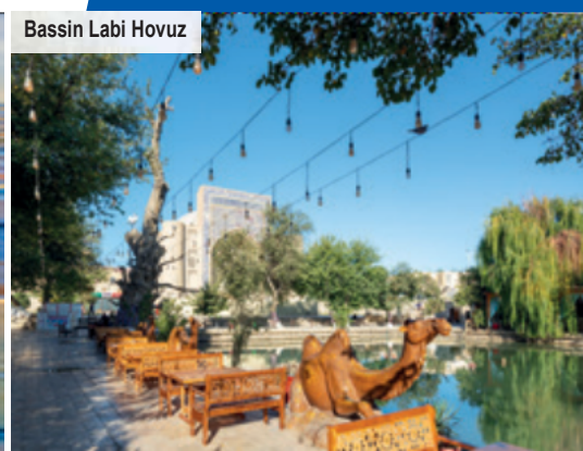
Bassin Labi Hovuz