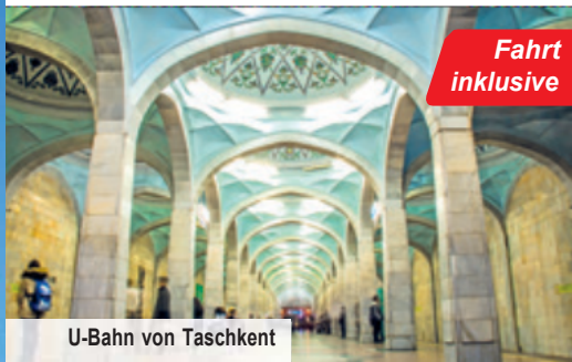
U-Bahn von Taschkent