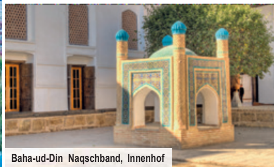
Baha-ud-Din Naqschband, Innenhof