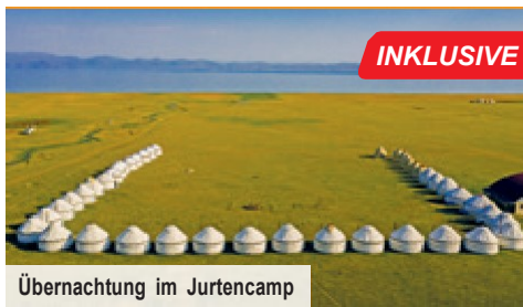
Übernachtung im Jurtencamp