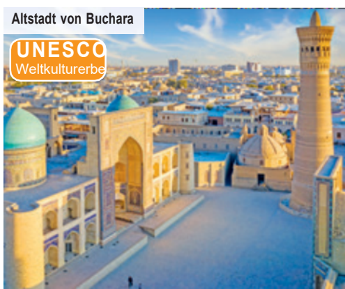
Altstadt von Buchara