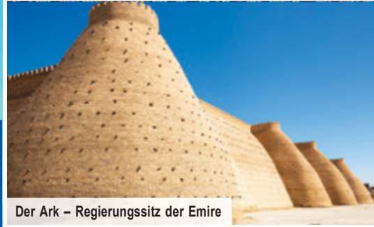
Der Ark – Regierungssitz der Emire

Große Stadtbesichtigung im UNESCO-Welterbe Samarkand mit den wichtigsten Sehenswürdigkeiten