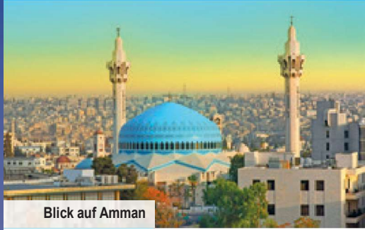
Blick auf Amman