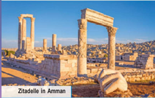
Zitadelle in Amman