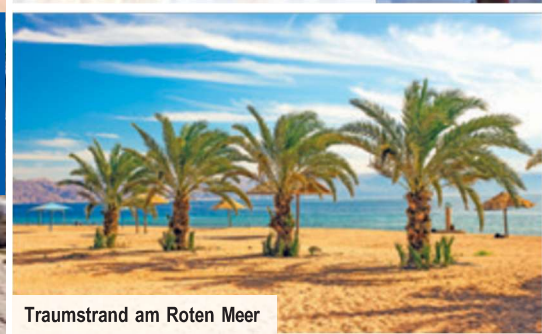
Traumstrand am Roten Meer