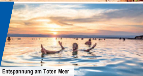
Entspannung am Totem Meer

Erlebnis-Genusspaket mit Weinprobe & Beduinen-Abendessen