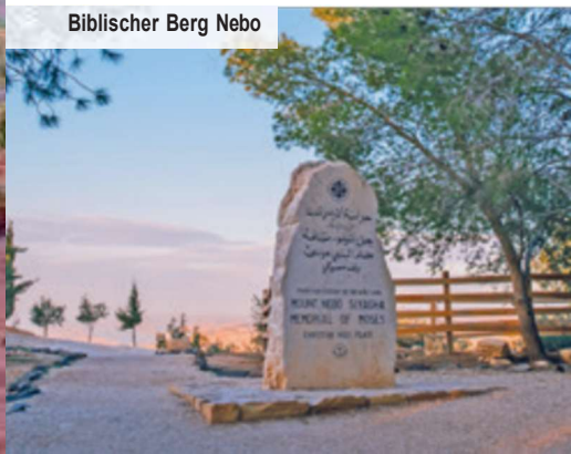
Biblischer Berg Nebo

Sand, so weit das Auge reicht! Über die historische Königsstraße erreichen Sie das Wüstenschloss Qusair Amra aus dem 8. Jahrhundert, das ebenfalls UNESCO-Welterbe ist. Daraufhin geht es weiter in Richtung Süden zur faszinierenden Ausgrabungsstätte Umm er-Rasas (UNESCO)