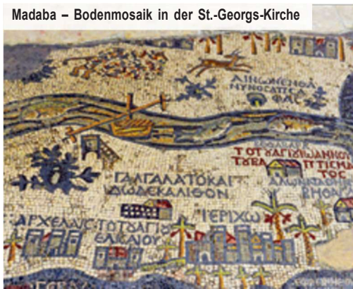
Madaba – Bodenmosaik in der St.-Georgs-Kirche