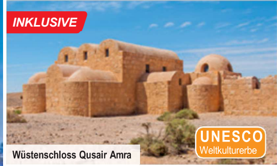
Wüsten Schloss Qusair Amra

Um Ihren Aufenthalt noch angenehmer zu gestalten, haben wir erholsame Badeaufenthalte am Toten & Roten Meer inkludiert. Lassen Sie es sich gut gehen!