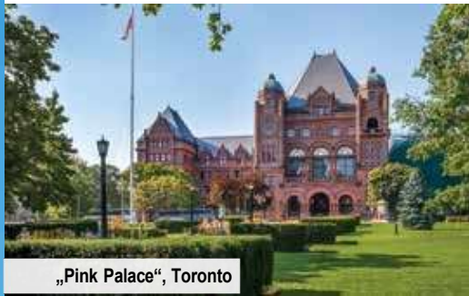
„Pink Palace“, Toronto