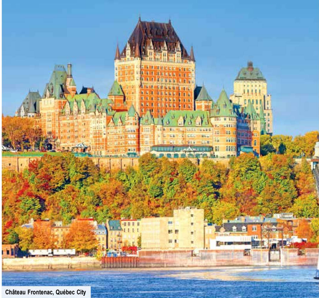
Château Frontenac, Québec City