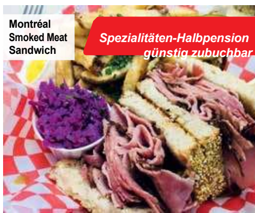
Montréal Smoked Meat Sandwich

Spezialitäten-Halbpension günstig zubuchbar