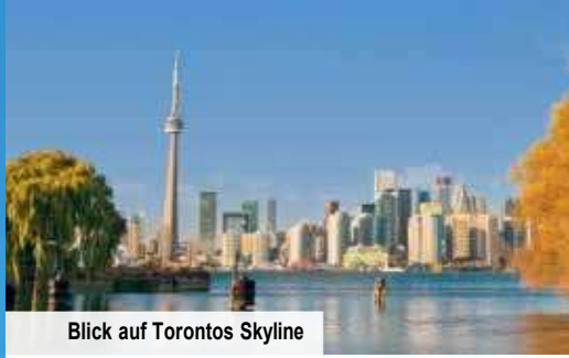
Blick auf Torontos Skyline