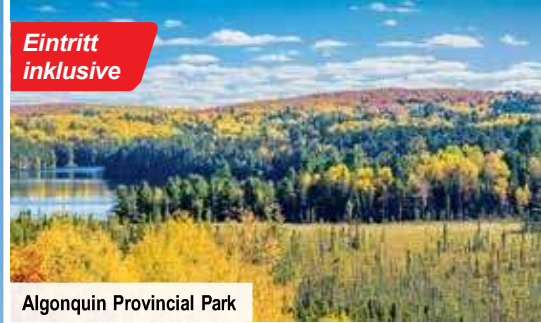
Algonquin Provincial Park