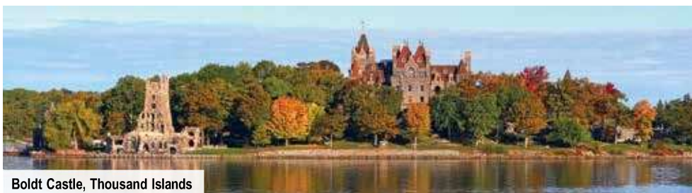
Boldt Castle, Thousand Islands

Einreisebestimmungen: Für die Einreise nach Kanada benötigen Deutsche, Schweizer sowie alle EU-Staatsbürger einen maschinenlesbaren Reisepass, der mind. bis zum Reiseende gültig ist, sowie eine elektronische Einreiseerlaubnis (eTA = electronic Travel Authorization). Die Beantragung ist gegen Aufpreis auch über trendtours möglich. Die Einreiseerlaubnis wird für fünf Jahre erteilt und ist an den jeweiligen Reisepass des Antragstellers gebunden. (Stand: Februar 2025)