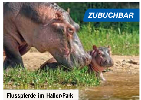
Flusspferde im Haller-Park

Auf Ihrem Weg zurück zu Ihrem 4-Sterne-Strandresort genießen Sie noch einmal ein Picknick (nicht inkl.) in der Savanne. Wie Ihr schönster Traum kommen Ihnen die letzten 5 Tage im Landesinneren Kenias vor.