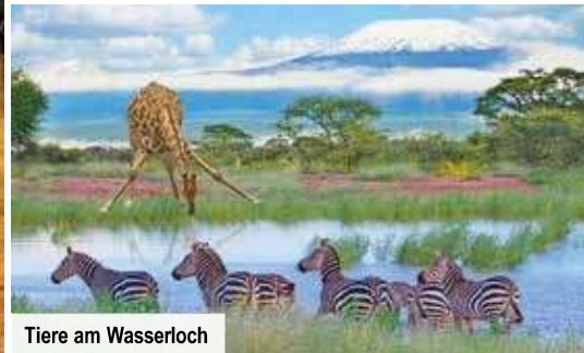
Tiere am Wasserloch

Das Schutzgebiet ist weltweit bekannt für seine intakte Elefanten-Population. Neben jungen Tieren leben auch viele alte Elefantenkühe und -bullen im Schutzgebiet, sodass das komplexe Sozialverhalten hier gut beobachtet werden kann.