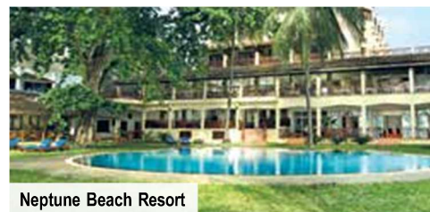
Neptune Beach Resort