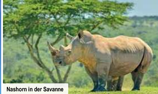
Nashorn in der Savanne