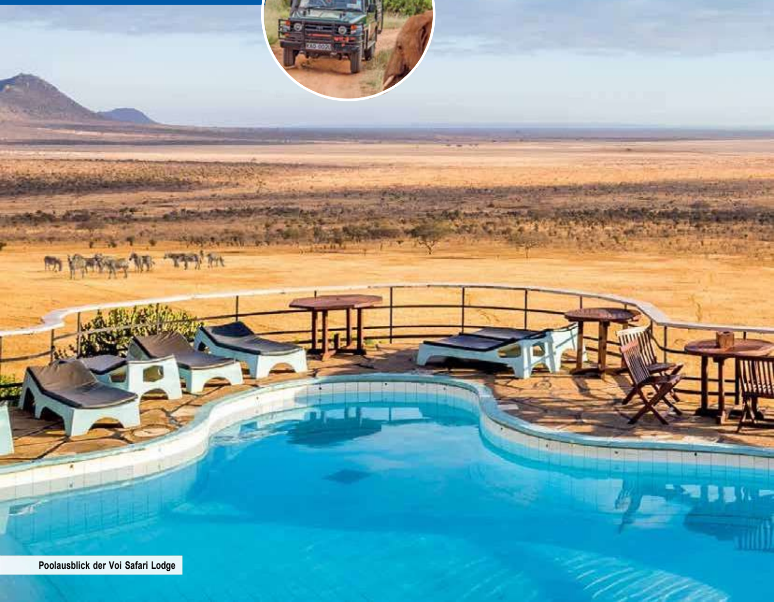
Poolausblick der Voi Safari Lodge