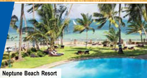
Neptune Beach Resort

7 Tage im 4-Sterne-Strandhotel am Indischen Ozean mit All Inclusive