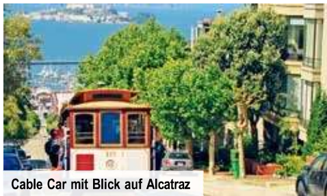
Cable Car mit Blick auf Alcatraz

Für Alleinreisende ½ Doppelzimmer (Zweibett) ohne Aufpreis Unterbringung mit einer Person gleichen Geschlechts Doppelzimmer zur Alleinbenutzung + € 60 p. N.