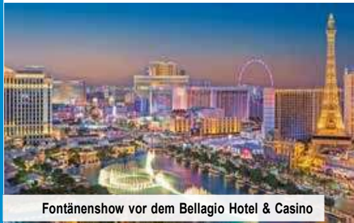
Fontänenshow vor dem Bellagio Hotel & Casino