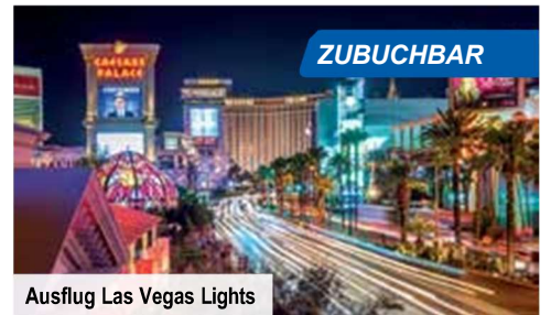
Ausflug Las Vegas Lights