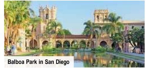
Balboa Park in San Diego

Ausflug nach San Diego Stadtbesichtigung von San Diego mit Highlights wie dem Hafen, Balboa-Park und Gaslamp Quarter, inklusive deutschsprachiger Reiseleitung Bei Vorabbuchung € 89 p. P.