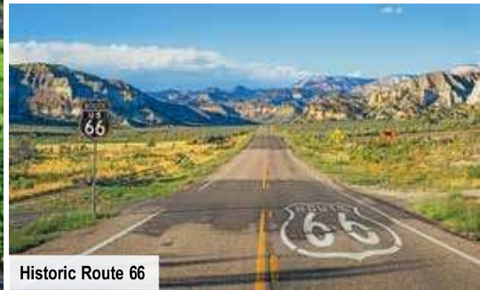
Historic Route 66

wiederm wohnen die Reichen und Schönen. Sie übernachten heute und morgen im Raum Los Angeles.