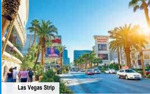
Las Vegas Strip