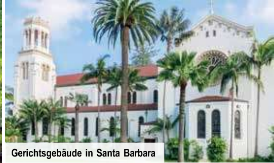
Gerichtsgebäude in Santa Barbara