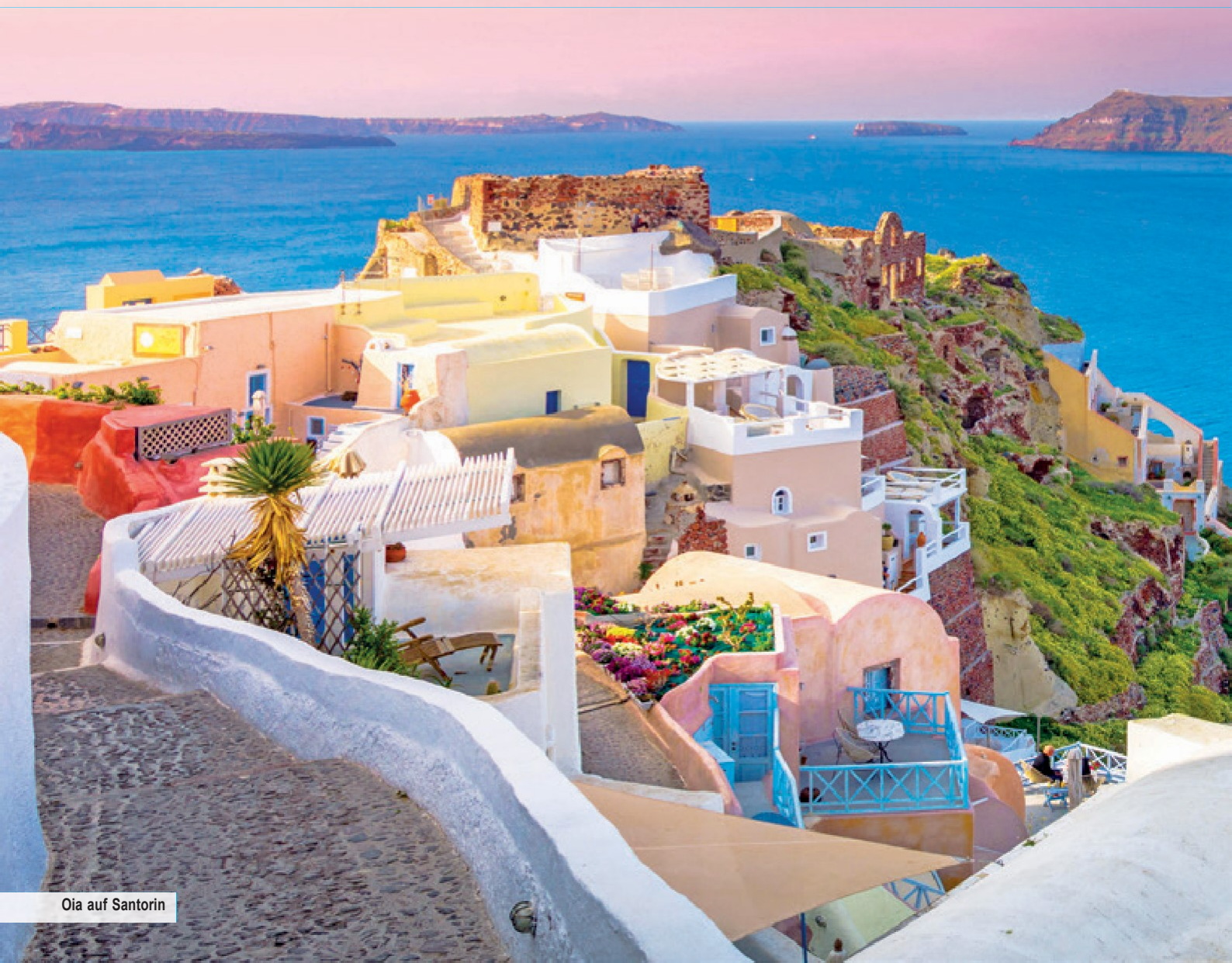
Oia auf Santorin

In Kusadasi stechen Sie dann in See und sichten die griechischen Inseln Rhodos, Santorin, Mykonos und Samos auf einzigartiger Kreuzfahrt in der unergründlichen Weite der Ägäis. Mit der Türkischen Westküste und den griechischen Inseln schnüren wir Ihnen ein unwiderstehliches Urlaubspaket, das durch 4- oder 5-Sterne-Hotels mit Halbpension und Vollpension Plus an Bord Ihres Kreuzfahrtschiffes MS Blue Sapphire wunschlos glücklich macht.