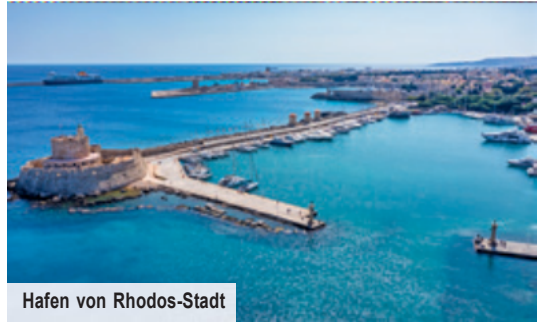
Hafen von Rhodos-Stadt