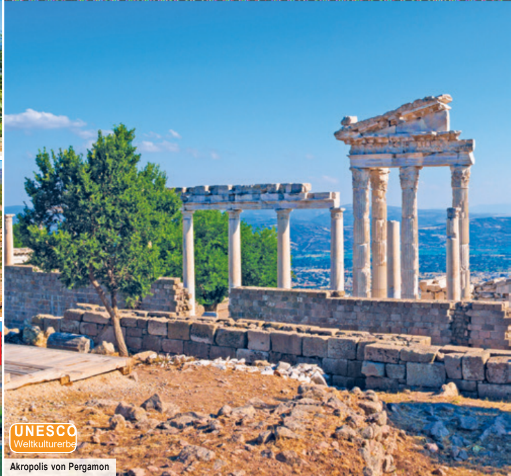
Akropolis von Pergamon