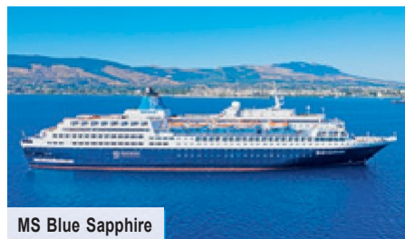
MS Blue Sapphire

Die Blue Sapphire bietet Ihnen sehr geräumige Kabinen mit höchstem Komfort. Die Vollpension inkludiert neben den 3 Hauptmahlzeiten alkoholfreie & ausgewählte alkoholische Getränke zu den Mahlzeiten sowie Teezeit & Nachtsuppe.