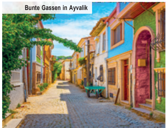
Bunte Gassen in Ayvalik

Voller einzigartiger Erinnerungen treten Sie an Tag 12 den Heimflug an oder erleben auf Wunsch eine Woche 5-Sterne-Strandurlaub mit All Inclusive an der türkischen Riviera.