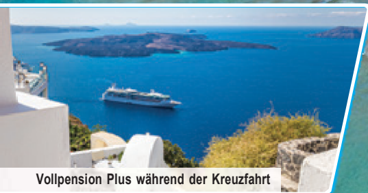
Vollpension Plus während der Kreuzfahrt

Kreuzfahrt mit den Inseln Rhodos, Santorin, Mykonos & Samos