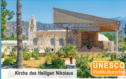
Kirche des Heiligen Nikolaus