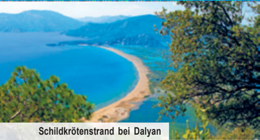
Schildkrötenstrand bei Dalyan