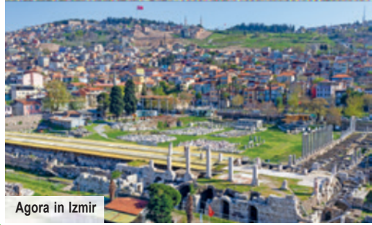
Agora in Izmir