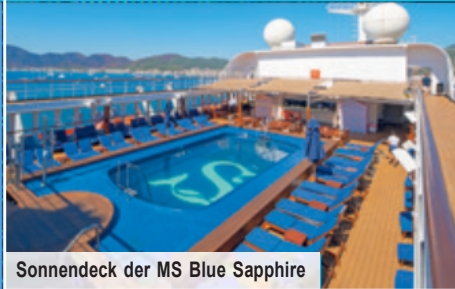
Sonnendeck der MS Blue Sapphire