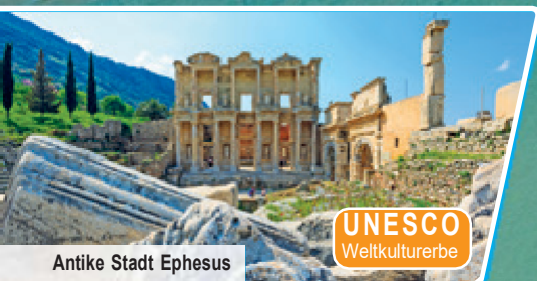
Antike Stadt Ephesus