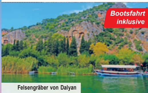
Felsengräber von Dalyan