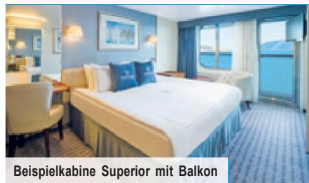
Beispielkabine Superior mit Balkon